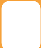
Ludan GENY LIST Physique Ingénierie