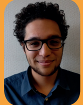
Ilyas KENADID Droit