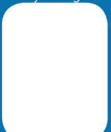
Laure Grimonprez Arts plastiques